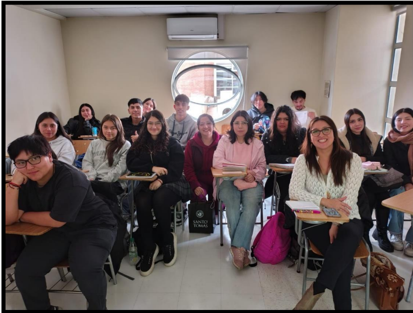
Imagen 2: Estudiantes UST que fueron capacitados para ser Vigilantes ambientales 2025

Con el apoyo de los nuevos Vigilantes Ambientales, la SEREMI de Salud coordinó y ejecutó tres (3) actividades informativas sobre los contenidos del PDA y del cuidado de la salud de la población: