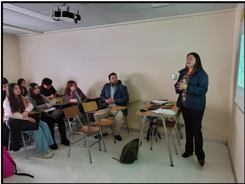
Imagen 1: Profesional de la Unidad de Evaluación Ambiental y Calidad del Aire exponiendo ante estudiantes