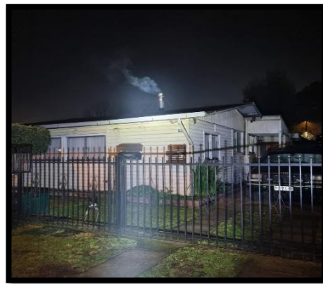
Registros fotográficos de humos visibles en viviendas durante fiscalización GEC