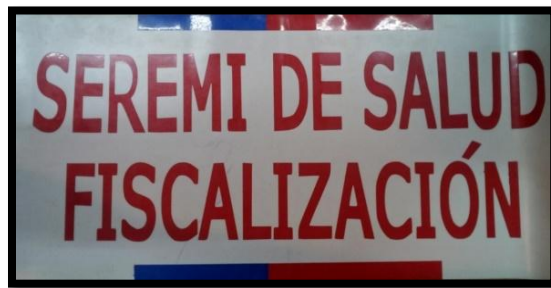
Identificación institucional para vehículos

Los funcionarios fiscalizadores contarán con vestimenta con logo institucional y portarán credencial institucional que los identifica como tales. Su traslado será en vehículos debidamente identificados como vehículo de uso estatal y de fiscalización, con el logo que se muestra en la siguiente imagen: